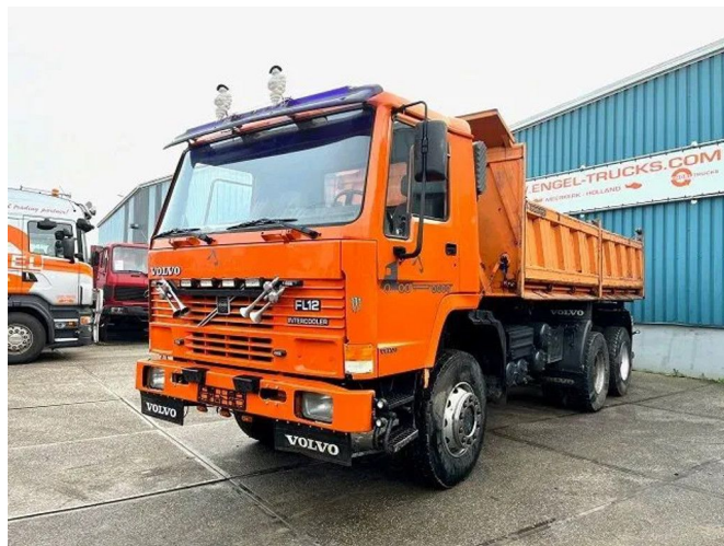
Volvo FL 12.380 6x6 FULL STEEL SUSPENSION MEILLER K...