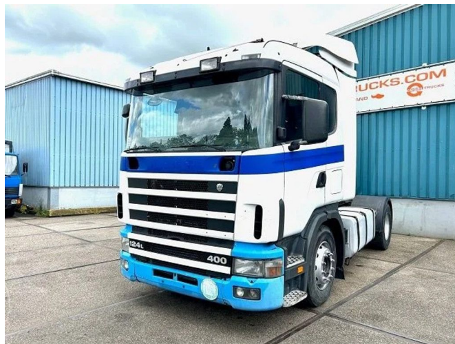
Scania R124-400 L 4x2 SLEEPERCAB ADR/VLG (2 FUEL LI...