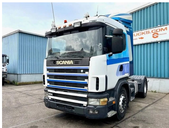
Scania R114-340 LA 4x2 (2 FUEL LINES!!) (EURO 2 / 12 GE...