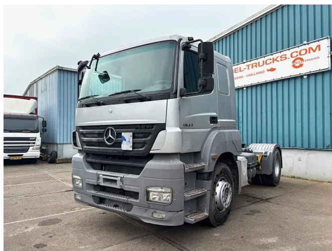
Mercedes-Benz Axor 1843 LS SLEEPERCAB (MANUAL... 4x2