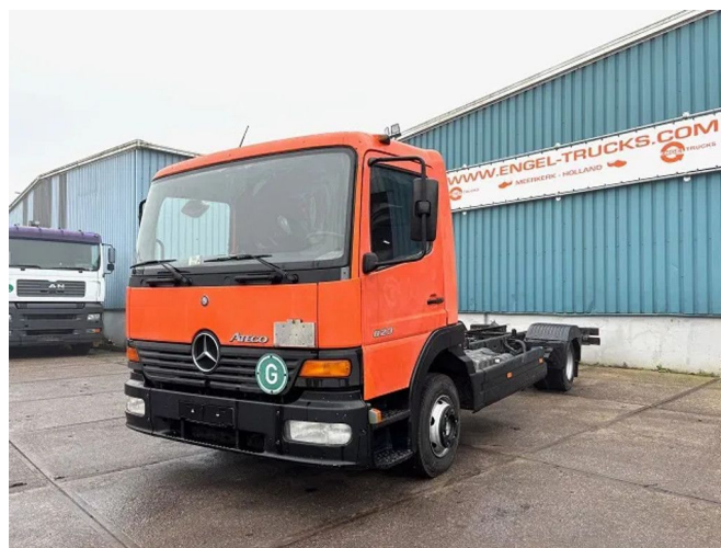
Mercedes-Benz Atego 823L DAY CAB (6-CILINDER) 4x2 CH...