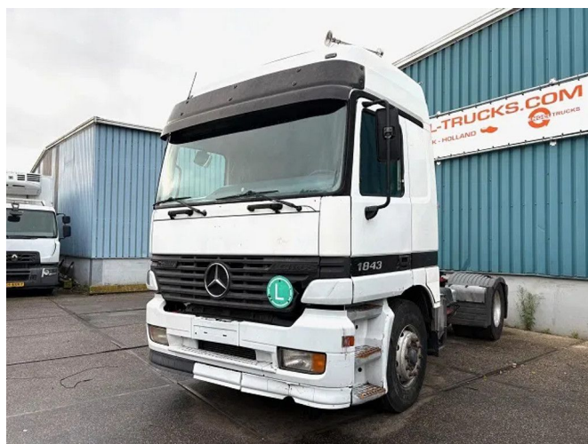
Mercedes-Benz Actros 1843 LS (MP1) (EPS WITH CLU... 4x2