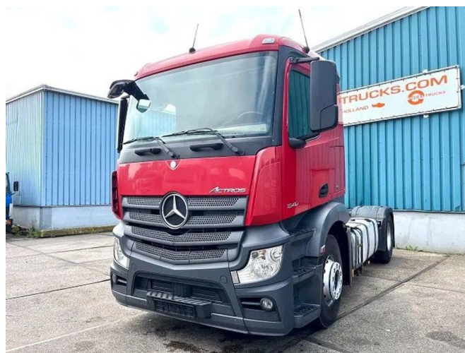
Mercedes-Benz Actros 1840 LS SLEEPERCAB (4x AVA... 4x2 Referentienummer: SN 55422332