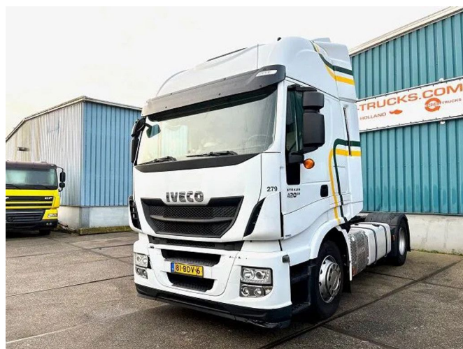
Iveco Stralis AS440S42T/P HI-WAY DUTCH TRUCK (A... 4x2 Referentienummer: SN 54222611