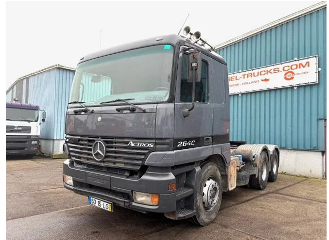
Mercedes-Benz Actros 2640 S 6x4 FULL STEEL TRACTOR ...