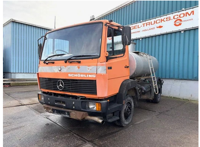
Mercedes-Benz 914 KO RHD 4x2 FULL STEEL TANK TRUCK... Referentienummer: SN 57816153