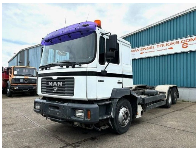
MAN 26.414 FNL-T (6-CILINDERHEADS) 6x4 CHASSIS (EU...