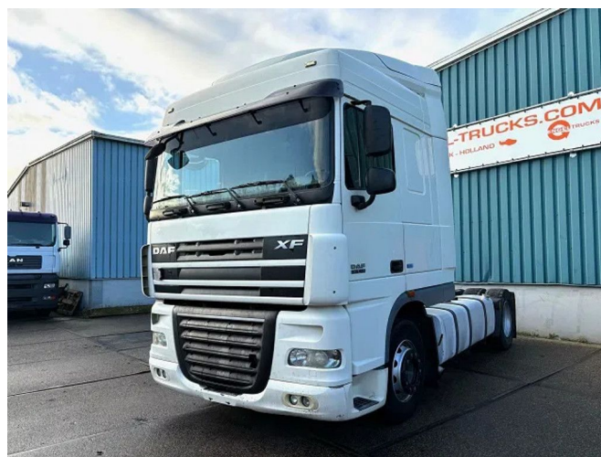
DAF XF 105.460 SPACECAB (ZF MANUAL GEARBOX / ... 4x2