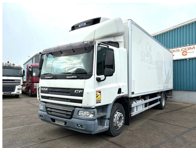
DAF CF 65.250 COOLING TRUCK WITH CARRIER D/E... 4x2