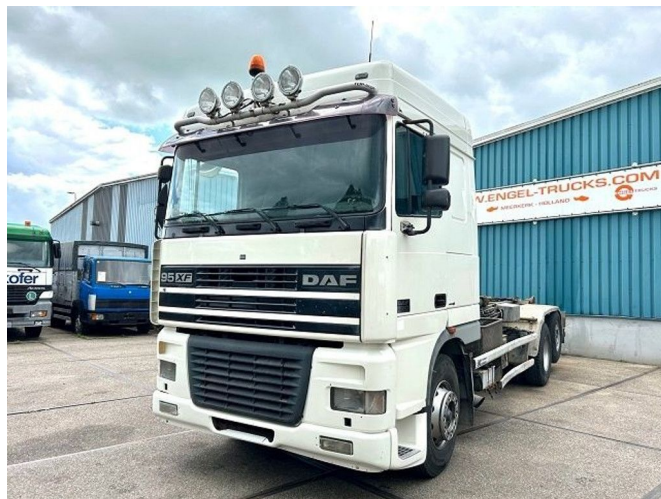
DAF 95.480 XF SPACECAB 6x2 WITH HOOK-ARM SYSTEM...