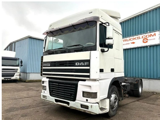
DAF 95.380 XF SPACECAB (EURO 2 (MECHANICAL ... 4x2 Referentienummer: SN 56068266 Z