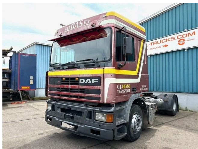
DAF 95.360 ATI SPACECAB (DUTCH TRUCK) (EURO 2... 4x2