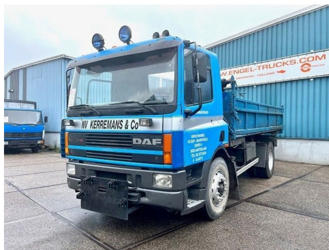
DAF 65.210 ATI 4x2 FULL STEEL KIPPER (EURO 2 / MANU...