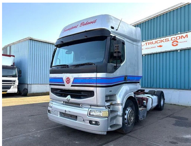
Renault Premium 400 .18T ROUTE 4x2 (POMPE MANUELLE...