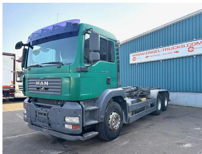
MAN TGA 26.360BB 6x4 FULL STEEL MULTILIFT HOOK-A...