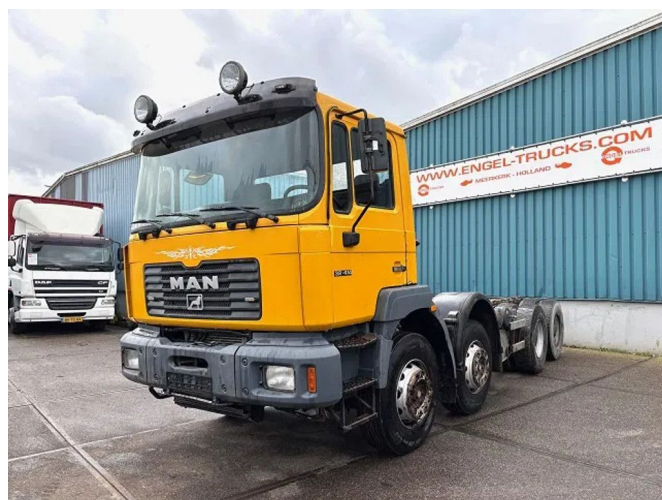
MAN 35.414 VF-TM 8x4 FULL STEEL CHASSIS (6-CILINDER...