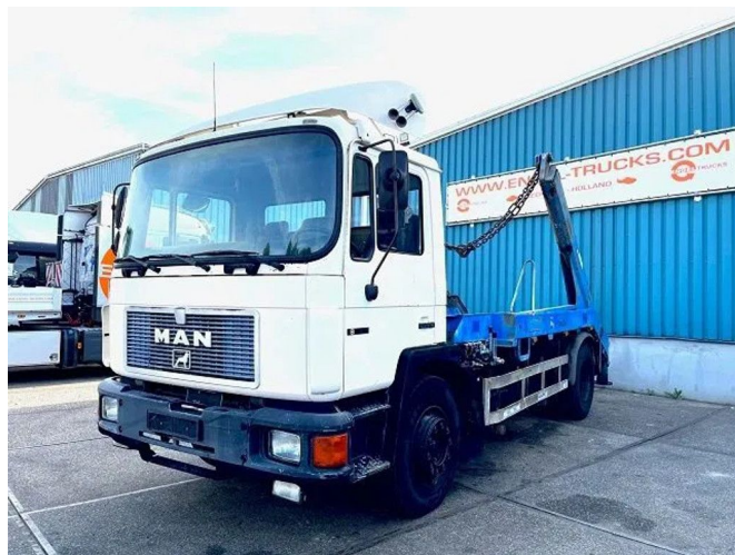
MAN 18 .232 (6 CILINDER) M90 WITH TELESCOPIC ... 4x2 Referentiennummer: SN 55609062