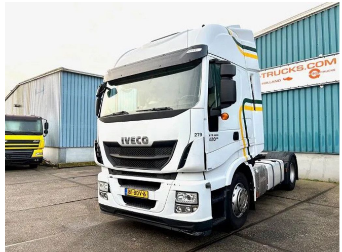
Iveco Stralis AS440S42T/P HI-WAY DUTCH TRUCK (A... 4x2 Referenznummer: SN 54222611