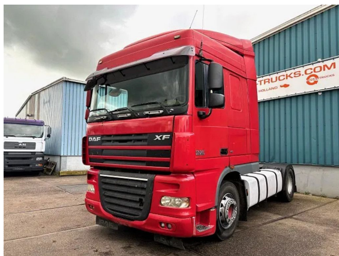
DAF XF 105.460 SPACECAB (ZF16 MANUAL GEARB... 4x2