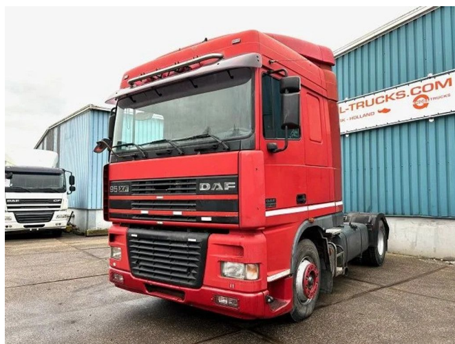
DAF 95.480 XF SPACECAB (EURO 3 / ZF16 MANUAL ... 4x2