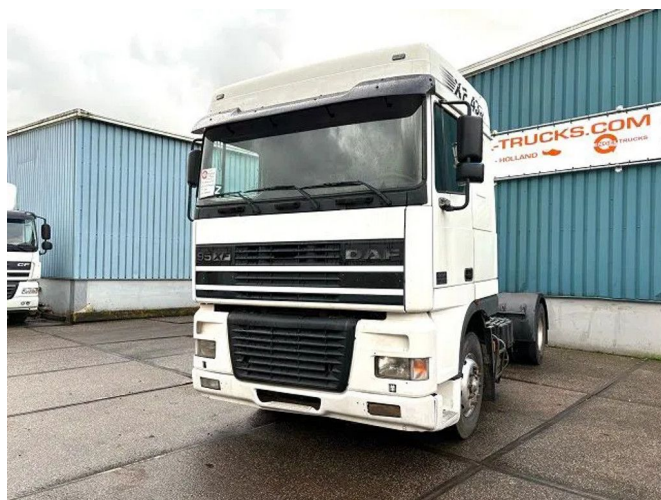
DAF 95.430 XF SPACECAB (EURO 3 / ZF16 MANUAL ... 4x2