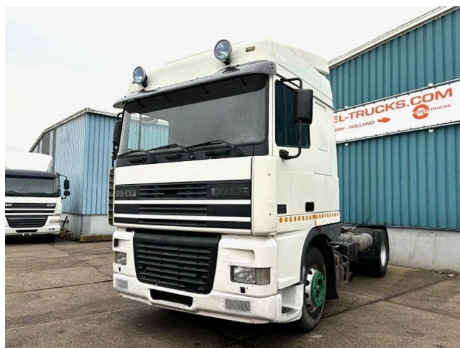
DAF 95.430 XF SPACECAB (EURO 2 / ZF16 MANUAL ... 4x2